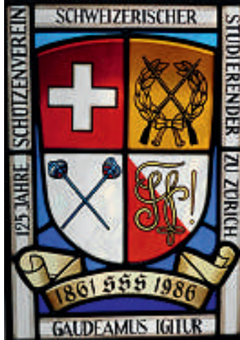
Wappenscheibe des SSS 1866