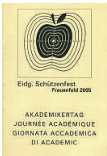
Liederbuch zum Akademikertag ESF 2005

Anhand dieses Beispiels sowie der vielen anderen während des Lockdowns gezeigten erkennt man, dass vieles aus dem Schützenwesen längst nicht nur dieses selbst betrifft, sondern auch andere Lebensbereiche, Interessensgebiete usw. tangiert. Dies künftig verstärkt aufzuzeigen, mag – vielleicht zunächst nur im Kleinen – dazu beitragen, dass sich das Schützenwesen wieder stärker in der Mitte unserer Gesellschaft positionieren kann. ●