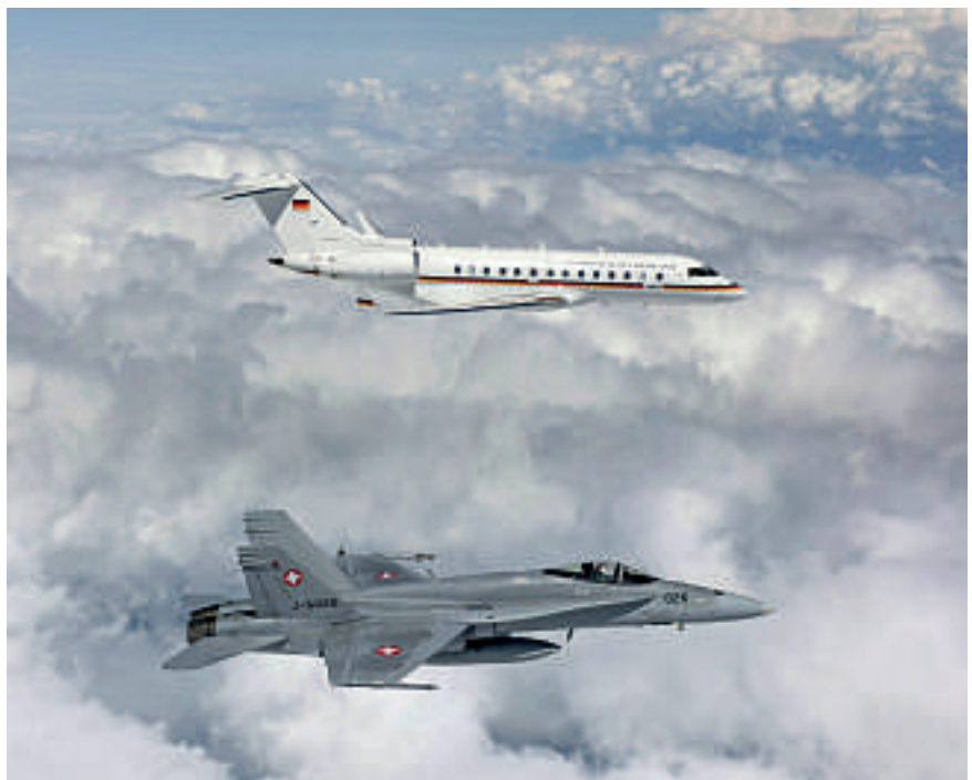
Ein Flugzeug der Bundesrepublik Deutschland wird von einem Abfangjäger der Schweizer Luftwaffe begleitet.

* Der Westschweizer Claude Nicollier ist Militär, Linien- sowie NASA-Testpilot und Astronaut. Er war der erste und bis jetzt einzige Schweizer, der den Weltraum besuchte.