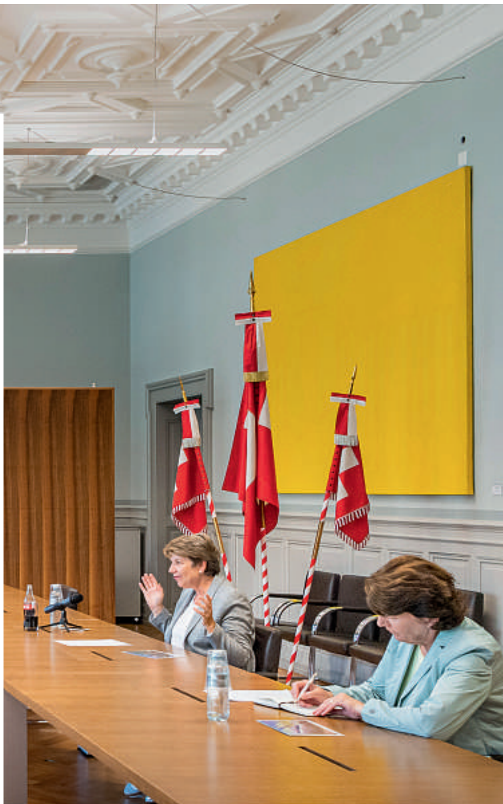
Die beiden Redaktoren im Gespräch mit Viola Amherd. Die Bundesrätin wurde von ihrer persönlichen Beraterin begleitet.