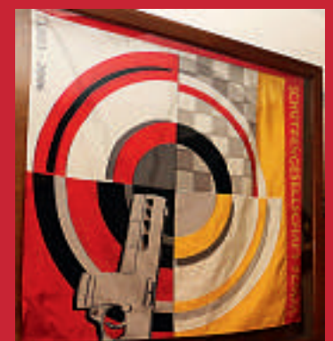
Diese Fahne erhielt die Schützengesellschaft Flawil zum 203. Geburtstag 2006.

Die Schützengesellschaft Flawil (SGF) ist über 200-jährig. Gegründet 1803, wurde 1892 ein Revolverclub eingegliedert. Die 1904 erworbene Schützenwiese am Rand der St. Galler Kleinstadt geriet in den 60er-Jahren mehr und mehr unter Siedlungsdruck, so dass die Schützen aufs Land ausweichen mussten. Im Girenmoos wurde eine neue Schiessanlage erstellt und 1981 in Betrieb genommen. Dort schiessen der Militärschützenverein (MSV) Alterswil-Egg (300m) und auf 50/25m die SGF, die heute ein reiner Pistolenschützenverein ist und 25 Aktivmitglieder zählt, davon 17 Lizenzierte. Nach dem Start in den 70er-Jahren auf dem Färberei-Areal fanden die Luftpistolenschützen Mitte der 90er-Jahre ihre neue Heimat in der Scheune einer Textilfabrik. Acht Laufscheiben wurden dort installiert. Vier davon sind nun im Keller untergebracht mit zwei Schiessplätzen für die fünfgeschüssige Luftpistole. Im Erdgeschoss gibt es neu acht elektronische Scheiben von Sius, die an der 44. Untertoggenburger Meisterschaft 2019 ihre Feuertaufe erlebten. Den Umbau für 110'000 Franken bewerkstelligte die SGF mit einem Sport-Toto-Beitrag, weiteren Sponsoren und vielen Eigenleistungen. (atp)