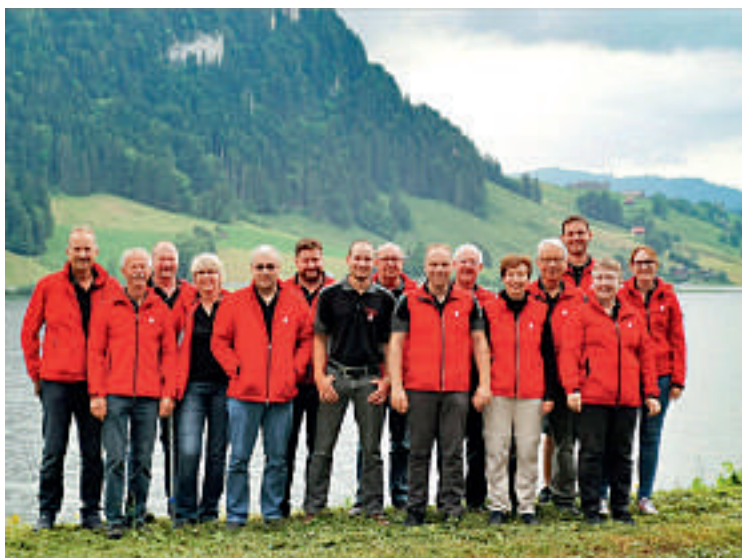
Sportschützen Vechigen am Kantonalschützenfest Schwyz 2019

— Der Schweizer Schiesssportverband (SSV) hat den Sportschützen Vechigen die Organisation der Schweizermeisterschaften 10m und des olympischen Sportschiessens für die kommenden zwei Jahre übertragen. Die ersten Vorbereitungen sind bereits am Laufen.