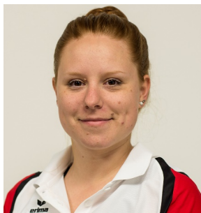
Nina Christen Wolfenschiessen NW 07.02.1994