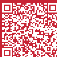
Flyer Apprendistato e sport d'elite