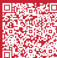
Organigramma Sport - Cultura - Studio, Bienne