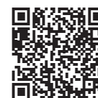
Centri regionali di prestazione a Losanna, Schwadernau, Lucerna, Filzbach e Teufen Ulteriori informazioni: www.swissshooting.ch/it/nachwuchs

GESTIONE DEL TEMPO OTTIMALE PER ALLENAMENTO CRP/CNP