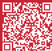
Concetto CNP Forma 3 Speranze