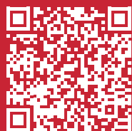
Concetto promovimento sport di prestazione