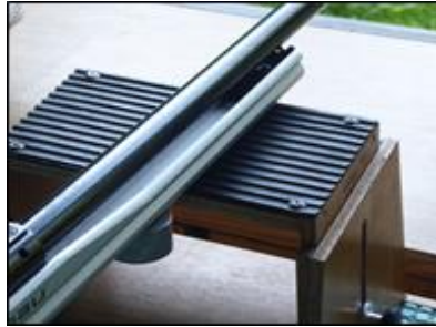
Support plat, longueur maximale de 20cm