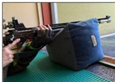
Le support n'est pas plat

Il doit y avoir 5cm de part et d'autre du fût