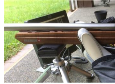
Support plat, main au fût

- La main tenant le fusil ainsi que l'arrêteur de main ne doivent pas toucher l'appui.