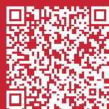
Poster «La carrière de l'athlète»