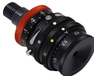
Iris und Kombi-Filter