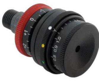
Iris und Farbfilter